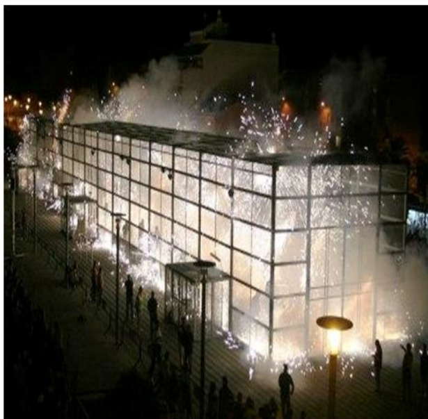
Imágenes de archivo del pasacalle infantil de cohetes de lujo de Paterna y del cohetódromo.