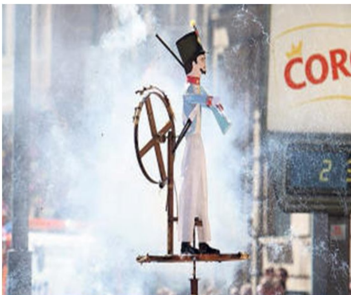
QUEMA DE MANDAMITAS, EN UNA EDICIÓN ANTERIOR