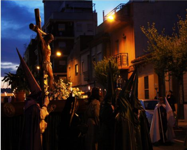
Santísimo Cristo de la Paz.

HORTANOTICIAS.COM El lunes, a las 20.00 horas, se celebró una Misa en la Iglesia de La Natividad y, a continuación, salió en procesión el paso de Jesús de Medinaceli. El martes día 3, la Iglesia del Sagrado Corazón acogerá la celebración de la Misa, a las 20.00 horas y, una vez finalizada, saldrá la procesión de la Cofradía del Santísimo Cristo de la Paz.