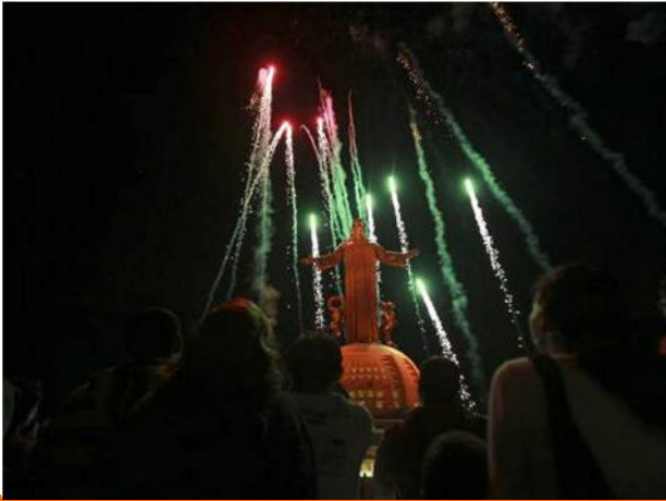
Benedicto XVI encendió por control remoto la luz y un espectáculo de fuegos artificiales